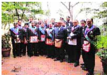
Integrantes de la R.:L.: Fraternidad N° 4

Con motivo de ser el 29 de Mayo el «Día mundial del anciano», la logia inauguró un programa más a su ya exitosa lista de actividades Filantrópicas, cual es la campaña “Años Dorados” que procura dar apoyo a instituciones dedicadas al cuidado de ancianos.