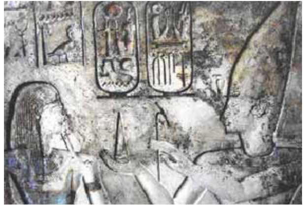
Imagen de un relieve de uno de los templos descubiertos.

Los arqueólogos egipcios han descubierto cuatro templos faraónicos amurallados, que datan del Imperio Nuevo (1539-1075 a. C.) y del Primer Periodo Intermedio (2125-1975 a. C.), en la península del Sinaí, en el noreste de Egipto.